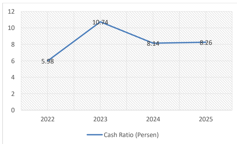
Gambar 2 Cash Rasio (Persen) BPR Syariah HIK (Audited) 2022-2024

Pada tahun 2025 persentase CR hasil audit tercatat sebesar 8,28 persen, menunjukkan peningkatan dari tahun 2024 yang sebesar 8,14 persen. Jika dilihat secara time series (2022-2025), CR tahun 2022 adalah 5,98 persen dan naik menjadi 10,74 persen.