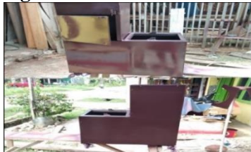
Gambar 3.1 Kerangka Utama

Rangka merupakan salah satu komponen yang sangat penting pada mesin penghisap asap pengelasan. Fungsi rangka ini adalah sebagaiudukan mesin dan komponen yang lain