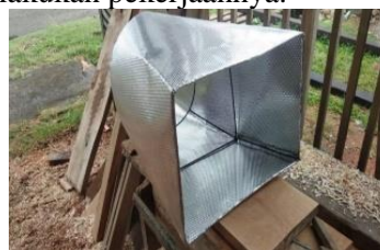
Gambar 2.8 Hood

Hood merupakan suatu struktur yang didisain untuk menutupi seluruh atau sebagian dari sumber kontaminan dan untuk mengendalikan aliran udara sedemikian rupa sehingga kontaminan dapat ditangkap dengan efisien. Partikel-partikel yang dilepas atau yang dihamburkan oleh sumber kontaminan ke dalam udara akan di tangkap oleh hood dan selanjutnya partikel tersebut dibawa oleh aliran udara masuk, hood harus didesain sedemikian rupa sehingga tidak mengganggu operator dalam melakukan pekerjaannya.