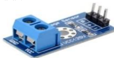
Gambar 3.1 Sensor

Sensor adalah komponen elektronika yang berfungsi untuk mengubah besaran mekanis, magnetis, panas, sinar, dan kimia menjadi besaran listrik berupa tegangan, resistansi dan arus listrik, sensor sering digunakan untuk pendeteksian pada saat melakukan pengukuran atau pengendalian. Beberapa jenis sensor yang banyak digunakan dalam rangkaian elektronika antara lain sensor cahaya, sensor suhu, dan sensor tekanan.