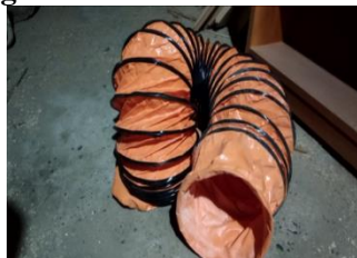
Gambar 3.4 selang portable ventilator

Selang portable ventilator merupakan selang yang digunakan oleh blower untuk mengalirkan buangan udara selang ini memiliki keuntungan yaitu tahan panas dan ringan sehingga selang ini sangat baik digunakan untuk mengalirkan pembuangan udara.