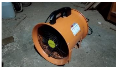
Gambar 3.3 Blower

Blower adalah mesin atau alat yang digunakan untuk menaikkan atau memperbesar tekanan udara atau gas yang akan dialirkan dalam suatu ruangan tertentu juga sebagai pengisapan atau pemvakuman udara atau gas tertentu. Banyak aplikasi-aplikasi dari blower yang banyak dikembangkan untuk sistem pendingin.