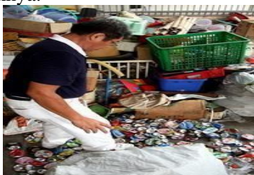
Gambar 2.4. Proses pengepresan secara manual

Berikut ini akan dibahas tentang cara pengepresan kaleng minuman secara manual, cara manual pada proses pengepresan kaleng minuman sangat sederhana, sebagian besar hanya menggunakan tenaga manusia dengan cara menginjaknya.