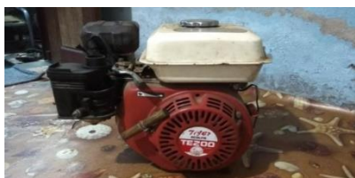
Gambar 4.1 Motor Bensin