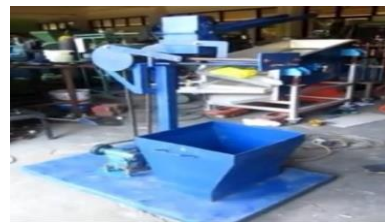
Gambar 2.5 Mesin Sliding Press

Sedangkan mesin prees kalaeng menggunakan Mesin sebagai berikut: