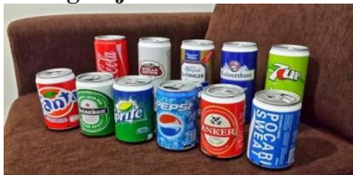
Gambar 2.3 Kaleng Aluminium