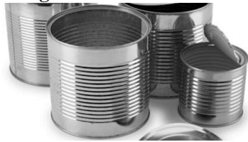
Gambar 2.1 Kaleng Plat Timah