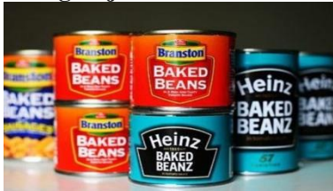
Gambar 2.2 Kaleng Bebas Timah