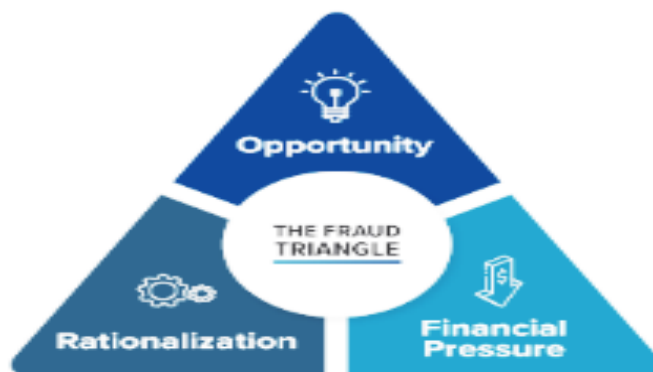
Gambar 2.1 Konsep Fraud Triangle .