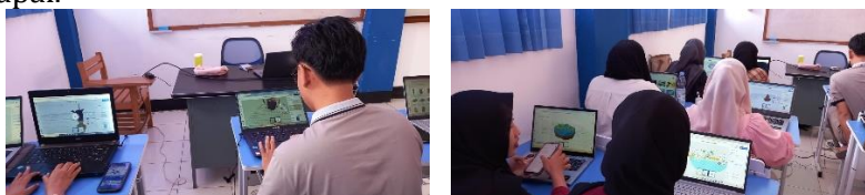
Gambar 2. Mahasiswa sedang mengembangkan konten IPA berbasis augmented reality menggunakan platform Assemblr Edu

Tahap monitoring dalam Project Based Learning dilakukan oleh dosen yang bertujuan untuk memastikan kualitas konten IPA yang dikembangkan tetap berada pada jalur edukasi yang benar. Selama proses pemantauan, platform Assemblr Edu memudahkan dosen untuk melihat kemajuan pengembangan konten IPA secara langsung, baik dari segi teknis pengoperasian fitur maupun kedalaman substansi materi. Monitoring bukan hanya sekadar pengawasan, melainkan juga sebagai sarana diskusi untuk mengatasi kendala teknis seperti kesulitan dalam memposisikan objek 3D atau keterbatasan fitur aplikasi (Situmeang, 2025). Interaksi intensif selama masa pemantauan ini memastikan bahwa aspek elaborasi dan akurasi ilmiah mahasiswa tetap terjaga, sehingga produk akhir yang dihasilkan benar-benar mampu menjadi media visualisasi IPA yang efektif dan meminimalisir risiko miskonsepsi bagi pengguna. Selama proses berlangsung, dosen melakukan observasi mendalam terhadap partisipasi siswa, termasuk keterlibatan dalam diskusi dan kemampuan mengembangkan konten IPA menggunakan fitur yang tersedia dalam platform Assemblr Edu . Keterlibatan langsung dalam aktivitas autentik ini terbukti meningkatkan kemampuan mahasiswa karena mereka memiliki kendali penuh atas tujuan yang ingin dicapai.