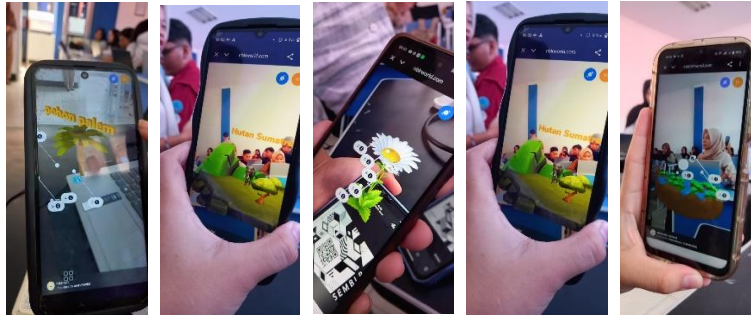
Gambar 2. Berbagai konten IPA berbasis augmented reality yang dikembangkan mahasiswa melalui PjBL

Tahap penyajian hasil project ini menonjolkan kemampuan elaborasi dan orisinalitas, dimana mahasiswa tidak hanya menyajikan produk, tetapi juga memberikan analisis mendalam mengenai pilihan desain mereka, seperti penempatan elemen dari berbagai perspektif. Interaksi tanya jawab antar kelompok dan pengujian oleh dosen berdasarkan kriteria penilaian produk menjadi sarana untuk mengukur kemampuan elaborasi siswa, yang merupakan salah satu karakteristik kunci dari kreativitas (Kadek, 2025). Secara keseluruhan, tahapan ini memberikan gambaran komprehensif mengenai efektivitas kolaborasi antara penguasaan konsep IPA dan keterampilan teknis dalam ekosistem pembelajaran berbasis proyek.